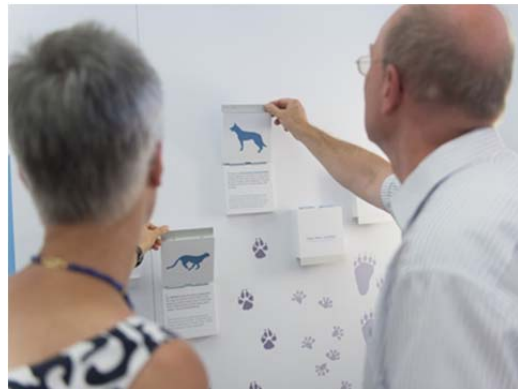
Wer ist hier vorbeigelaufen? Jede Art hat ihren unverwechselbaren Fußabdruck, der an den jeweiligen Lebensraum angepasst ist.