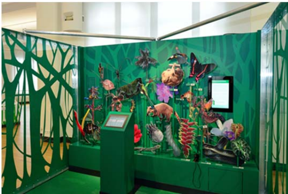
Bunte Vielfalt: Im Lebensraum Wald wimmelt's.