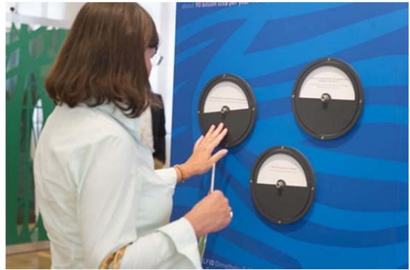
Anfassen erlaubt: spielerische Elemente veranschaulichen den Lebensraum Gewässer.